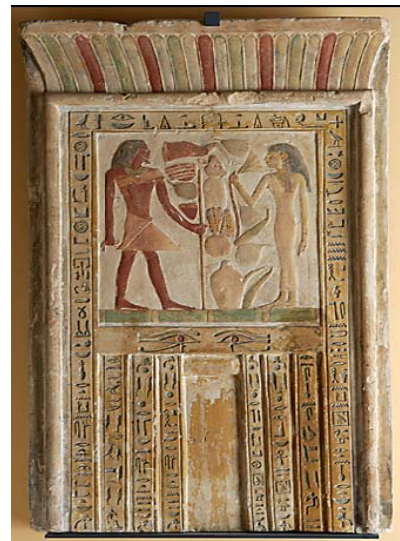
La dame Sathathor et son père Sénousret, C22, © Musée du Louvre/C. Décamps