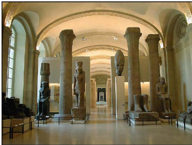
Sully, Rez-de-chaussée, Le temple (Salle 12)

http://temple.egyptien.egyptos.net/sens_de_visite/cour.php